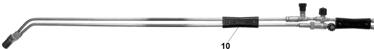
Рис. 2 Резак РЗПГсб (L=1300, 1500 мм)